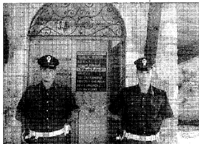
Commissariato Si cerca una nuova ubicazione

sta di più presenza sul territorio di uomini della Polstato, ma anche, nella prima quindicina del mese di luglio, la volante