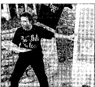
Un momento della lettura

ASSISI - (v. a.) Un successo quello di "Birba chi legge", letture in piazza e spettacoli dedicati ai più piccoli che domenica hanno animato piazze e vie della città. Un evento tanto più significativo in quanto la proposta mirava a coniugare divertimento e coinvolgimento nei più piccoli con il mondo del libro. Particolarmente apprezzato lo spettacolo scientifico degli Psiquadro. Ma il pezzo forte della manifestazione è stata la rappresentazione dell'autore e illustratore per bambini Gek Tesaro, che si è prodotto nello spettacolo "Cantare gli alberi", un'opera teatrale per lavagna luminosa, narrazione, ombre e musica dal vivo.