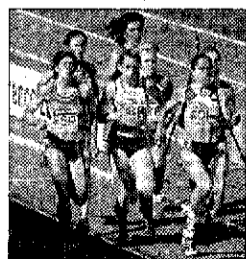
L'atletica a Bastia

BASTIA UMBRA - (r. b.) Sfileranno questa sera, a partire dalle ore 21 in piazza Mazzini, le ventuno delegazioni (in rappresentanza di tutte le regioni italiane e delle province di Trento e Bolzano) che parteciperanno all'edizione 2006 dei campionati italiani a squadre cadetti di atletica leggera, manifestazione organizzata dalla Federazione italiana di atletica leggera con la quale si inaugura la nuova pista di atletica di Bastia Umbra. Si tratta di un evento sportivo che porterà in due giorni a Bastia Umbra oltre un migliaio tra atleti, allenatori e accompagnatori, oltre ad amici e parenti ed appassionati di questo sport. Un'edizione che per gli stessi vertici della Fidal sarà memorabile, grazie anche al grande sforzo profuso dal comune di Bastia Umbra. Sarà questa l'occasione per inaugurare ufficialmente la pista di atletica (la cerimonia