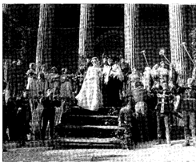
Calendimaggio Una suggestiva scena della rassegna