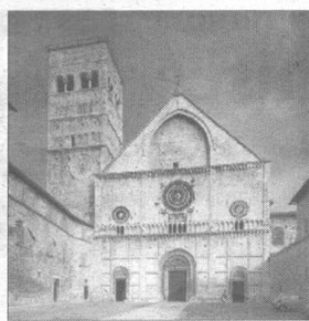
La chiesa di San Rufino

"Eravamo contrari nel 1998, tanto che demmo vita ad un comitato e a un dibattito sulla piazza di San Rufino, e lo siamo ancora di più oggi". Un progetto incompatibile con il tessuto storico - culturale della città, secondo l'avvocato. "Ci riferiamo - scrive - al vituperato buco con ascensore dentro l'orto di San Rufino, che continua a deturpare, con l'oramai abusivo capannone da cantiere ancora saldamente ancorato al terreno, l'orto più bello della città". Un'opera inutile, "fatta solo per lucrare i contributi del Giubileo". Ma la nuova amministrazione, "invece di fare marcia indietro e di tappare il buco popolato da sorci, si è pensato di sprecare altro denaro pubbli-