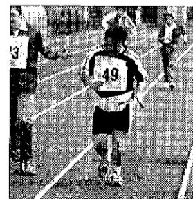
Lo sport unisce tutti

ASSISI - Oggi si svolge la prima giornata nazionale dello sport paraolimpico. L'evento sportivo è in programma contemporaneamente in sette città italiane. Assisi ha il privilegio di essere una di queste; le altre sei sono Roma, Bari, Bologna, Palermo, Torino e Verona. Le manifestazioni sportive previste per la giornata avranno inizio questa mattina alle ore 9 e si svolgeranno principalmente presso lo stadio Giuseppe Migagheli di Santa Maria degli Angeli. Ad