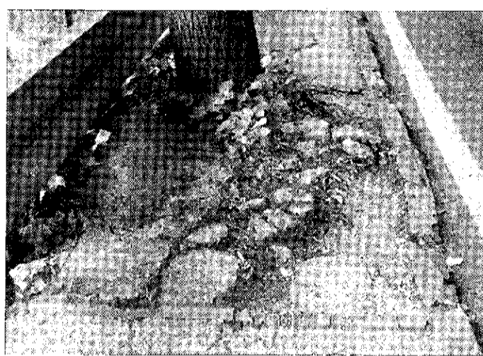
La 444 Le radici degli alberi sono riuscite a rialzare e spaccare l'asfalto, formando pericolosi dossi

ASSISI - Sono molti e di natura diversa i lavori che interessano la zona dell'Assiate in questo periodo. Sicuramente gli abitanti e i visitatori, locali e non, che percorrono la salita che dalla frazione angelana prosegue verso il centro storico, non hanno potuto non notare un semaforo che restringe la carreggiata della statale 147, con il segnale giallo di "lavori in corso". La competenza della manutenzione e mantenimento della strada, di proprietà dell'Anas, spetta per legge alla Provincia di Perugia.