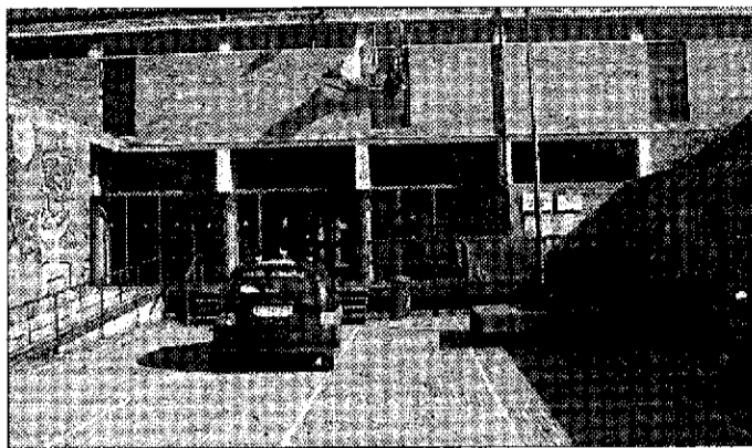
Particolare La media "Frate Francesco"

mantenere il numero di classi con i 127 studenti alla primaria e 108 alla media, ma il pezzo forte del-