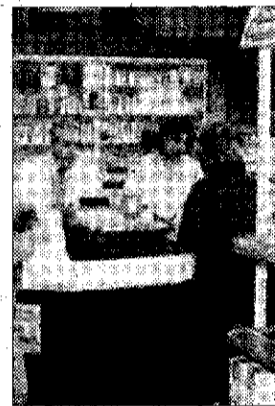
Farmacie La nuova società è tutta pubblica