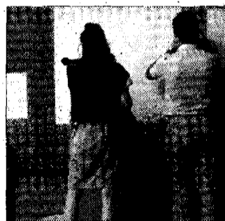
Curiosità intorno ai quadri