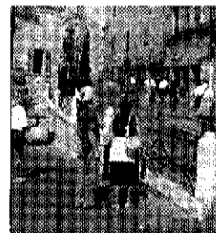
Turisti ad Assisi

ASSISI - Servizi turistici, Palazzo e Castelnuovo sono i prossimi obiettivi che la giunta comunale di Assisi si è prefissa di raggiungere. Proprio recentemente i progetti riguardanti le nuove opere pubbliche sono stati approvati. L'iniziativa che riguarda il settore turistico interessa proprio gli ospiti che Assisi accoglie numerosi durante tutto l'anno. Saranno infatti realizzati ben tre centri di informazione. I siti che ospiteranno le