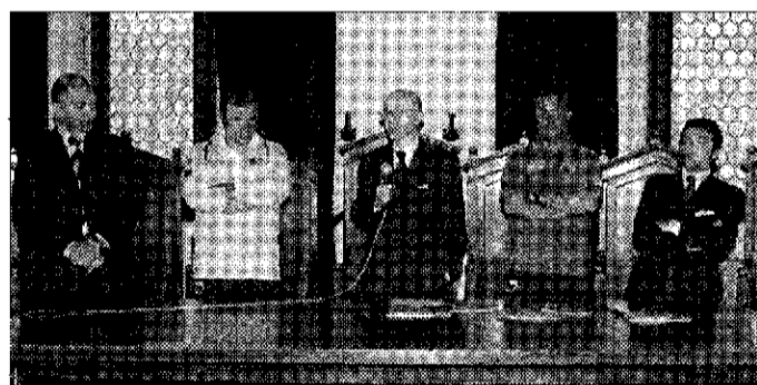
Atleti e amministratori L'incontro in Comune