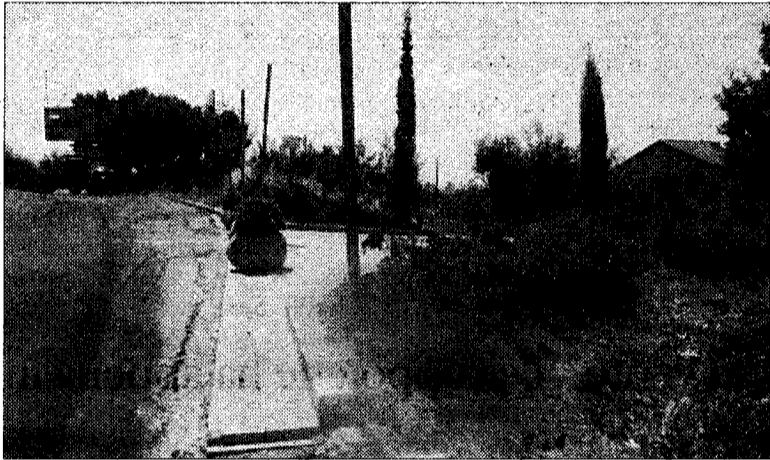
Una vergogna La zona in cui si trova la discarica

ASSISI - Sembra incredibile, eppure è vero. Nel comune di Assisi, patrimonio mondiale dell'Unesco, nel 2006 oramai inoltrato c'è ancora una discarica a cielo aperto, per giunta sotto gli occhi di tutti. Purtroppo non si tratta di una scoperta recente, anzi. E' passato tanto di quel tempo da quando diversi cittadini hanno segnalato il problema che forse gli addetti ai lavori ne hanno perso memoria. Il cumulo di rifiuti in questione si trova sopra al liceo classico "Sesto Properzio", a lato della mattonata, nel punto in cui questa si incrocia con la strada principale che sale verso il centro storico. Si tratta quindi di una zona di passaggio per automobili, autobus e camper di turisti che speriamo siano "distratti" dal panorama di Assisi e della basilica del Santo che scoprono salendo. La prima, e