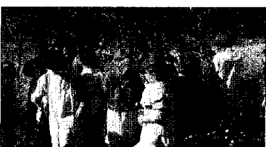
In campagna i bambini dai 3 ai 6 anni della scuola San Paolo

ASSISI - Un'indimenticabile esperienza di contatto con le origini e le tradizioni della campagna e della montagna umbra ha divertito e istruito i piccoli alunni della scuola dell'infanzia San Paolo dell'Istituto comprensivo Assisi 1. Protagonisti i bambini dai 3 ai 6 anni che hanno partecipato a due uscite didattiche. Nel primo caso, i piccoli hanno potuto assistere a una giornata di vendemmia presso un agriturismo di via Madonna dei Tre Fossi. Gli alunni hanno potuto osservare le varie fasi della raccolta e della spremitura dell'uva, sperimentando in prima persona il taglio dei grappoli dai filari dei vigneti. Ai piccoli è stato poi mostrato il procedimento di torchiatura e la fase dell'imbottigliamento e della decantazione. Oltre alla vendemmia, i proprietari dell'agriturismo hanno aperto alla classe le porte delle loro