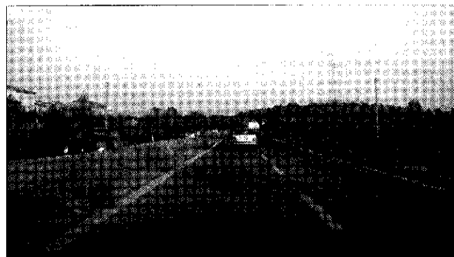
Statale 75 Necessario completare lo svincolo