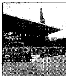
Presto sorgerà la tribuna

dato che si tratta di un intervento di miglioramento di tutta l'area sportiva, atteso e richiesto da molti anni, che potrà essere utile anche per le attività sociali e legate al tempo libero promosse dalle numerose, e molto attive, associazioni di Petrigliano".