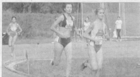
Pista di atletica La Pallamano rivendica spazio autonomo

BASTIA UMBRA - L'Asalb ha inviato una lettera aperta al sindaco di Bastia all'indomani della realizzazione della pista di atletica leggera.