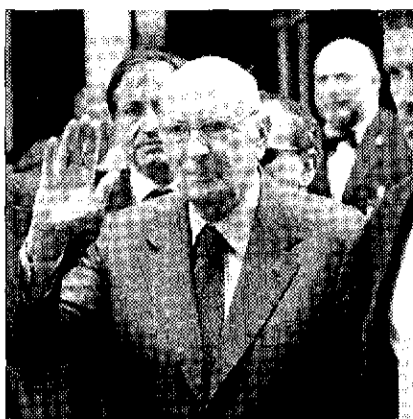
Il presidente della Repubblica Giorgio Napolitano. A destra un'altra grande occasione di preghiera per la pace, l'ultima visita di Wojtyla nel 2002

Dopo vent'anni, durante i quali il messaggio del Pontefice ha attraversato le principali città italiane e capitali europee, Assisi è ancora una volta il centro di propulsione di una cultura del confronto e della pace: "Per un mondo di pace. Religioni e culture in dialogo" è dunque il tema centrale del meeting internazionale e della nuova giornata di preghiera per la pace che si svolgerà domani e martedì. Le due giornate di ricer-