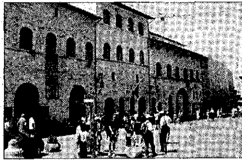
Assisi Chiude parzialmente al traffico