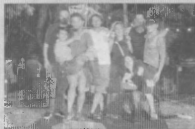
In compagnia In occasione del Festival

BASTIA UMBRA - (a.g.) - Si è concluso giovedì scorso, al centro sociale di Campiglione, l'Historical Route 147 Festival. Il ricco e vario programma delle manifestazioni ha proposto diverse tipologie di serate, che hanno tutte raccolto consensi e apprezzamenti da parte del pubblico. Nella manifestazione di apertura,