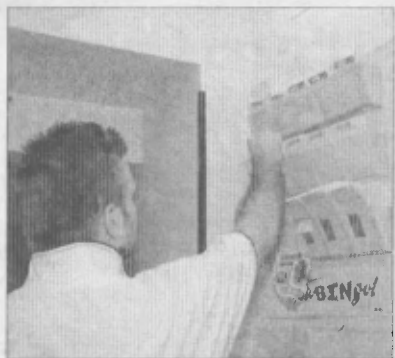
Cannara brinda La dea bendata stavolta ha premiato un giocatore "locale"

CANNARA (m.b.) - E' festa grande a Cannara e dintorni. Un fortunato giocatore ha puntato due euro e cinquanta centesimi e ha intascato oltre 118mila euro, centrando un pesante cinque. La schedina del superenalotto è stata giocata nella centralissima ricevitoria di Marcello Sereni, ubicata in piazza San Matteo. Ricevitoria fortunata, già salita alla ribalta della cronaca per vicine cospicue. Il titolare, pur trincerandosi dietro uno scontatissimo "no comment", di certo conosce il nome del fortunato avventore, che stando ai boatos di paese è un cannaresse, tra l'altro molto conosciuto. E mentre la voce di popolo si arricchisce di nuovi particolari, non resta che brindare idealmente a