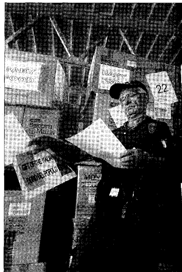
Solidarietà A Brindisi un volontario della protezione civile controlla gli aiuti umanitari per il Libano imbarcati sulla San Marco