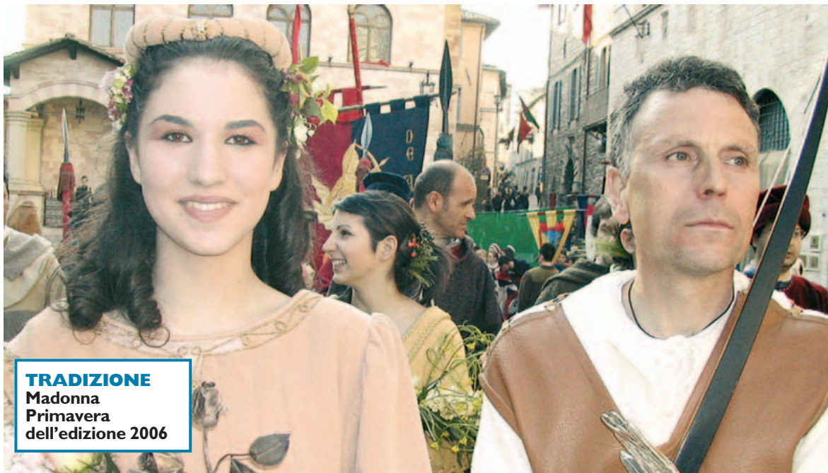
TRADIZIONE Madonna Primavera dell'edizione 2006