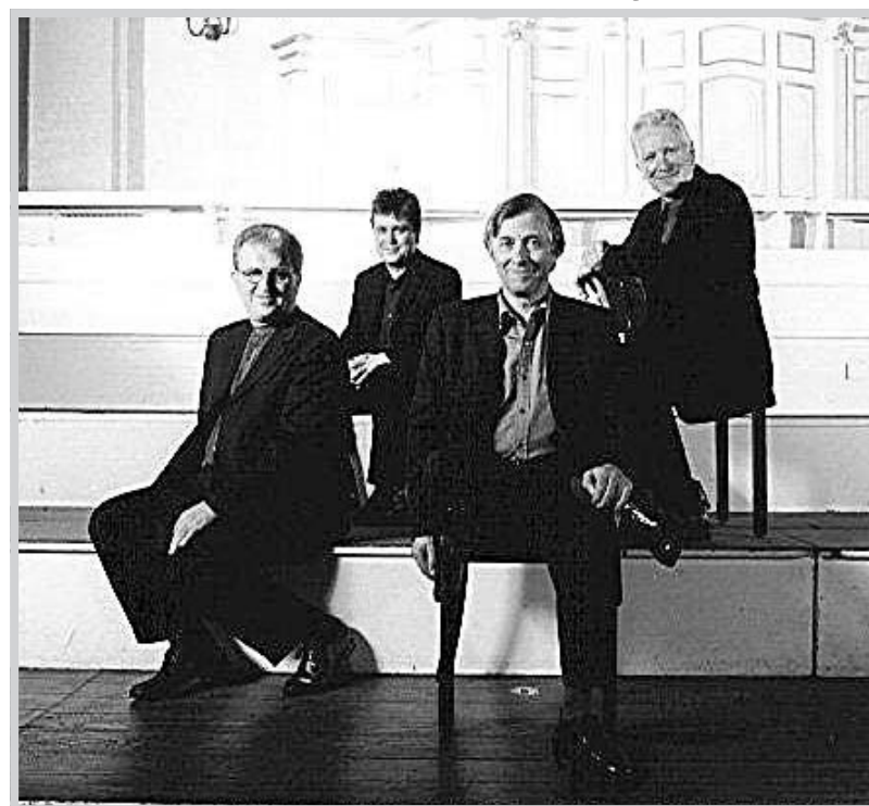
THE HILLIARD ENSEMBLE The Hilliard Ensemble, uno dei più prestigiosi gruppi vocali di musica da camera del mondo, sarà stasera ai Notari

Un'occasione preziosa, quindi, per ammirare alcuni dei vertici