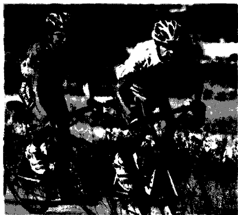
XII giro ciclistico dell'Umbria Grande successo di pubblico per la terza tappa che si è svolta ieri a Bovara di Trevi