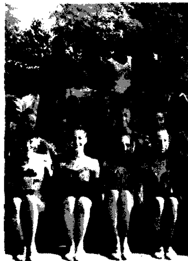
Il gruppo delle atlete umbre della ginnastica ritmica