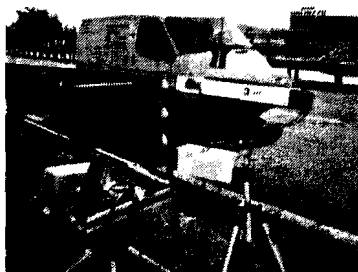
Contro l'alta velocità

Questo, ovviamente, non impedisce che ulteriori servizi di rilevazione della velocità potranno sempre essere attivati localmente in base a situazioni particolari (ad