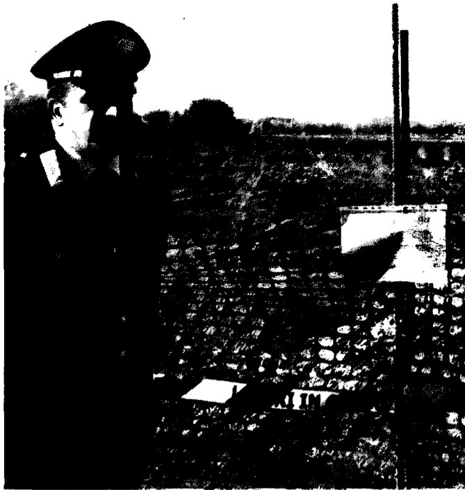
Nuova laguna L'ordinanza è stata emessa dal gip su richiesta della Procura della Repubblica; nell'area erano in corso lavori di ampliamento