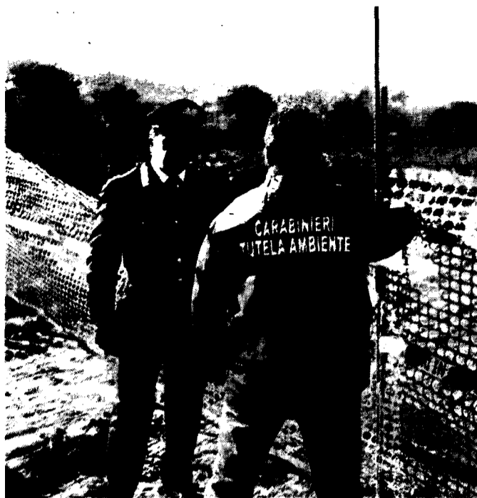
Sequestrata l'area Dai carabinieri del Noe per irregolarità in materia urbanistica e inadempienze

Dall'amministrazione comunale bettonese non filtra nessun commento, anche se il sindaco Lamberto