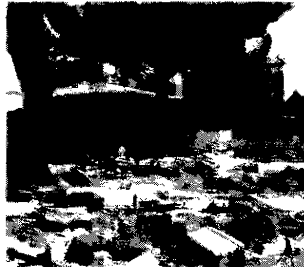
Ex piscina Eden Rock. Ciò che è rimasto