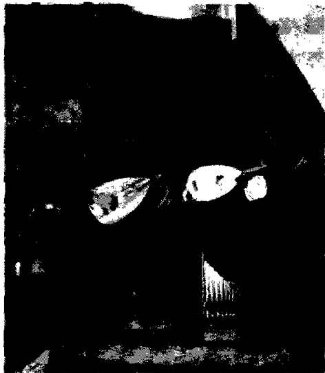
Palio di San Rufino Stasera il banchetto nella Rocca Maggiore

Questa sera, nella Rocca Maggiore, dimora dell'imperatore Federico II di Svevia, la Compagnia darà un banchetto cortese con antichi mestieri e spettacoli di guitti, mangiafuoco, dame e cavalieri a far da corona. L'appuntamento da non perdere è quello del 23 e del 24 quando verrà allestito un mercatino medioevale in via San Rufino, in ricordo della tradizionale fiera assisana durante il periodo dei festeggiamenti nazionali di San Francesco. Il 25 il calendario del Palio prevede l'investitura