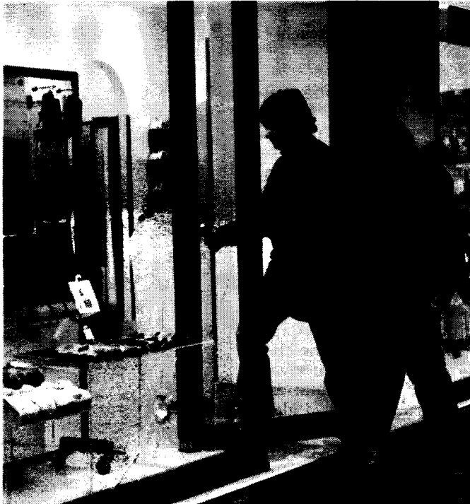
Regali a risparmio | I commercianti sperano che a ridosso delle festività la situazione cambi in positivo