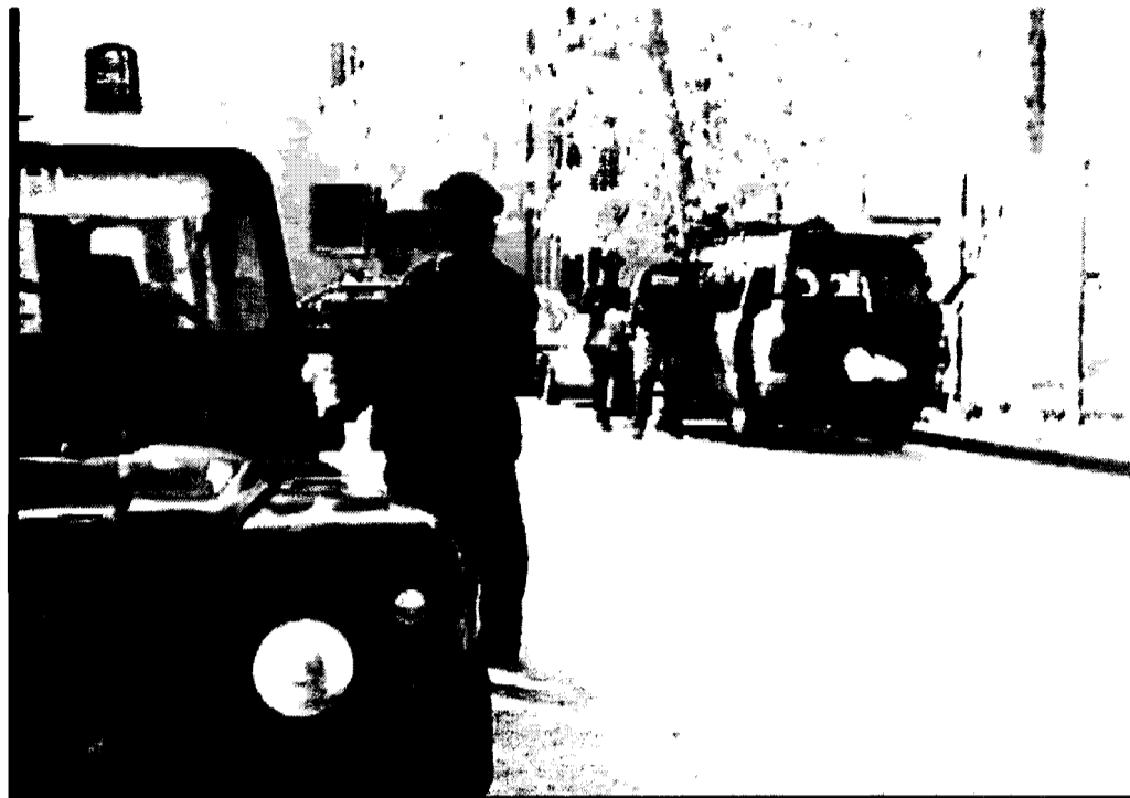
Carabinieri I militari sono riusciti a bloccare i tre zingari, tutti tra i 19 e i 27 anni, responsabili di un furto avvenuto ai danni di un supermercato Conad di Bastia, al quale avevano rubato due carrelli pieni di cibo