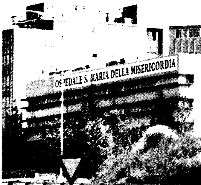
Incidente stradale Ricoverato a Perugia in gravi condizioni un campano

I costi per gli incidenti d'auto raggiungono cifre medie annue che superano i 31 miliardi di euro.