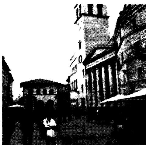
A Bastia Successo per la raccolta di firme