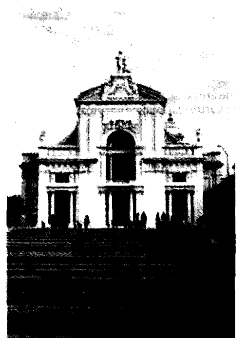
Santa Maria degli Angeli La centrale via Los Angeles sarà interessata da lavori di ammodernamento