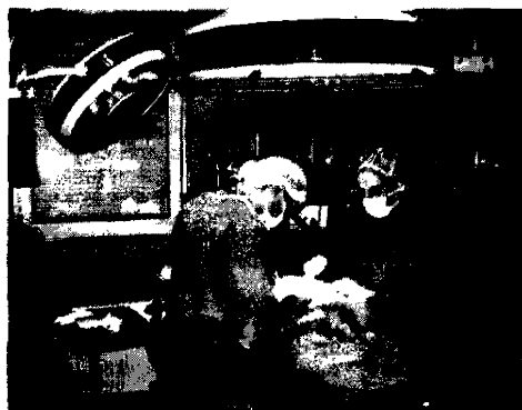
Ospedale il reparto di chirurgia ancora al centro delle polemiche in Comune