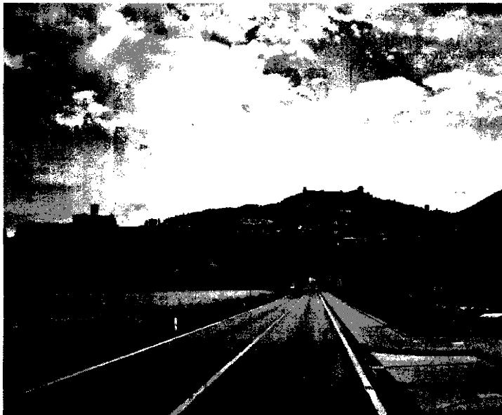
Assisi È stato inserito per la prima volta dopo oltre 50 anni la riqualificazione della zona Ivancich all'interno del consiglio comunale