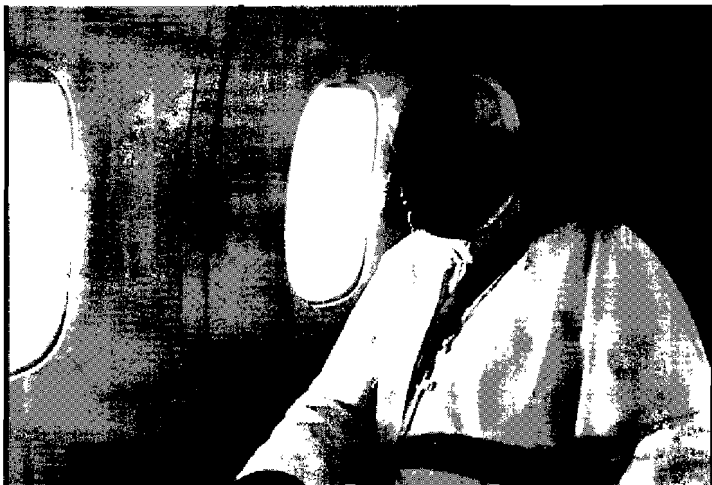
Arrivo in mattinata L'elicottero atterrerà sul campo sportivo di Rivotorto dove ad attendere il Pontefice saranno presenti le maggiori autorità regionali, provinciali e comunali

Molto atteso, inoltre, è l'incontro del Papa nella sala Capitolare con le suore clarisse cappuccine tedesche e quello nella cattedrale di San Rufino con il clero diocesano. Ultima tappa di Benedetto XXVI è in Santa Maria degli Angeli per l'incontro con moltissimi giovani provenienti da tutta Italia sul piazzale antistante la basilica della "Porziuncola". In serata il Pontefice si congederà da Assisi per ritornare a Roma. La macchina organizzativa è in pieno fermento per preparare tutto al meglio. Nel frattempo sono arrivati dei finanziamenti della Cassa di Risparmio di Foligno per mettere a punto gli aspetti logistici che riguarderanno, soprattutto Santa Maria degli Angeli con una serie di interventi che renderanno più ospitale la frazione e i luoghi d'interesse papale. Basti citare i giardini e i bagni pubblici senza dimenticare gli spazi antistanti la struttura basilicale angelana.