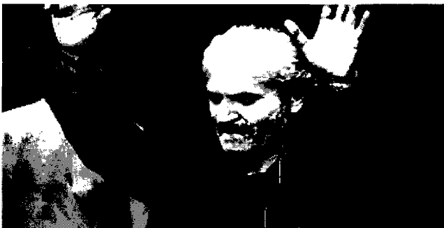
Gianni Versace Eleganza diffusa in tutto il mondo

BASTIA UMBRA - Si svolgerà il prossimo 31 agosto, al The Barr di Bastia Umbra, la serata di beneficenza in ricordo del grande stilista Gianni Versace, intitolata "It's your song". L'evento, patrocinato dal Comune di Assisi, prevede una cena con un'asta di beneficenza in favore dell'Associazione nazionale per la tutela della fanciullezza e dell'adolescenza di Milano. Durante l'asta verranno battuti alcuni capi d'abbigliamento appartenuti a Gianni Versace, cinque camicie e due gilet di proprietà di Antonio D'Amico, compagno dello