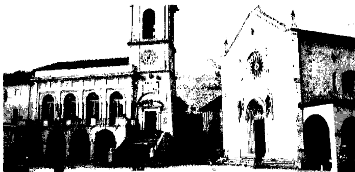
La premiazione Oggi alle 10.30 nella Sala del consiglio maggiore del Palazzo comunale