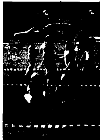
"C'era una volta un re" Pomeriggio dedicato ai bambini nei giardini di via Marconi