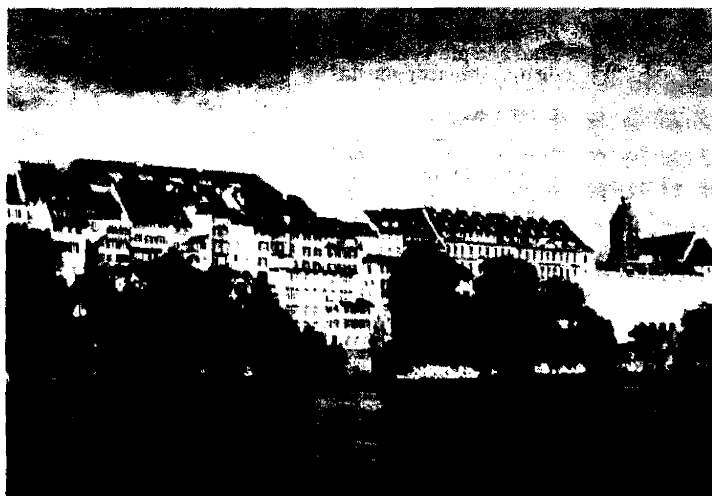
Basilea. La città svizzera da dieci anni fa parte del premio letterario "Fenice-Europa"

Giovedì 17 maggio (ore 21) si esibirà al teatro Morlacchi Angela Hewitt. Al pianoforte la musicista suonerà la partita n.4 in re maggiore di Bach. Il concerto di chiusura del mese è organizzato dalla Fondazione musica classica e dal dipartimento "Amici della musica". Info: 075-5722271, 3388668820