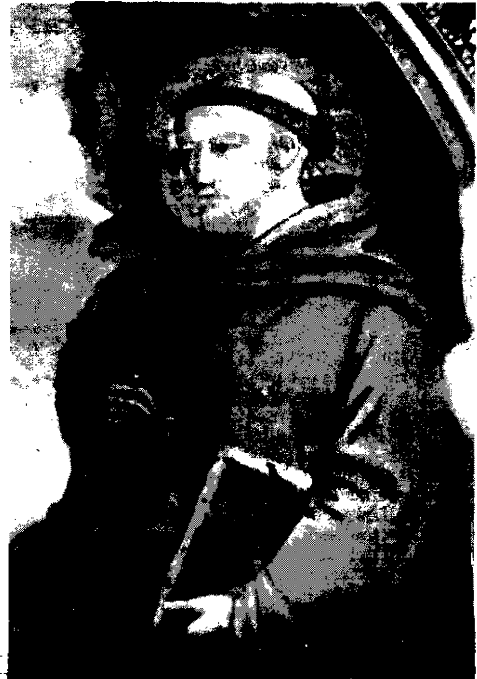
San Francesco 4 ottobre la Festa del Patrono d'Italia