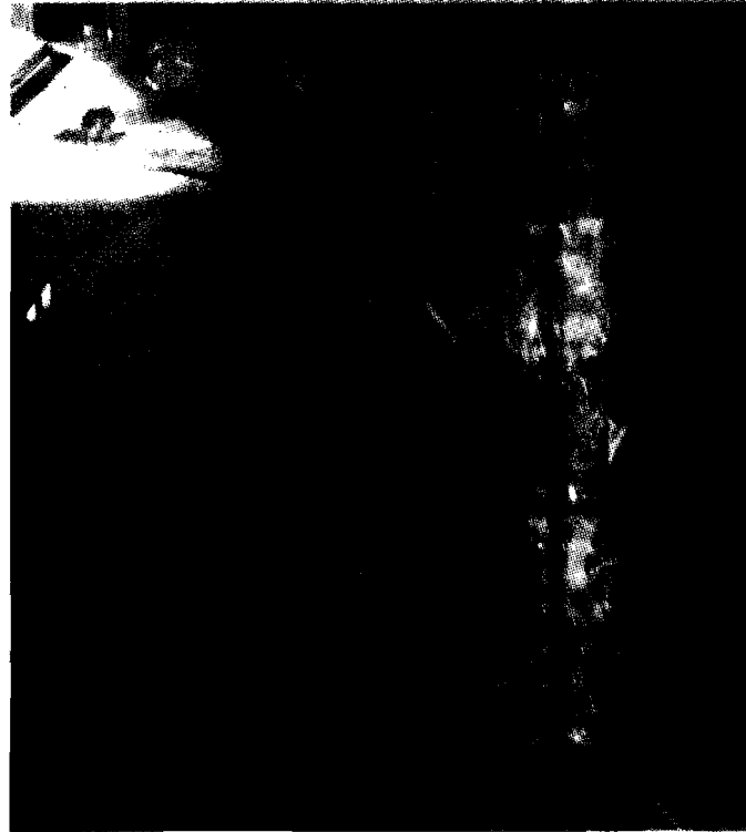
La spaccata Il danno è stato "solo" della porta a vetri. Ma i gestori sono in polemica per l'apertura oltre l'orario consentito della stazione

I lavori di restyling della stazione sono cominciati, ma non per questo la criminalità presente nella zona si dà meno da fare: a farne le spese, ancora una volta, è il bar Buffet, al centro di un tentativo di furto nella notte tra martedì e mercoledì. Secondo la ricostruzione delle forze dell'ordine intervenute sul posto, intorno a mezzanotte i ladri avrebbero prima tentato di forzare la porta, per poi spaccare il vetro dell'entrata interna: una manovra 'azzardata', che ha fatto immediatamente scattare l'allarme, collegato con il 112, e scappare i ladri. Se le perdite, vetro escluso, sono quindi pari a zero, a far 'arrabbiare' i gestori del locale è però la dinamica del furto, visto che, contrariamente a quanto accaduto le altre volte, i ladri hanno tentato di forzare la porta interna, con la stazione aperta ben oltre l'orario di chiusura per mezzanotte: una 'svista' di Centostazioni (che gestisce la stazione di Santa Maria degli Angeli) puntualmente segnalata dai proprietari del bar, che hanno chiesto maggior 'cura' nel rispetto degli orari. Per il bar della stazione non