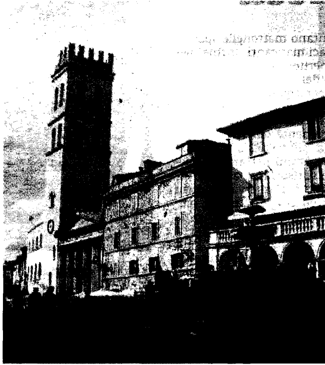
Bilancio Discussione fiume in Consiglio