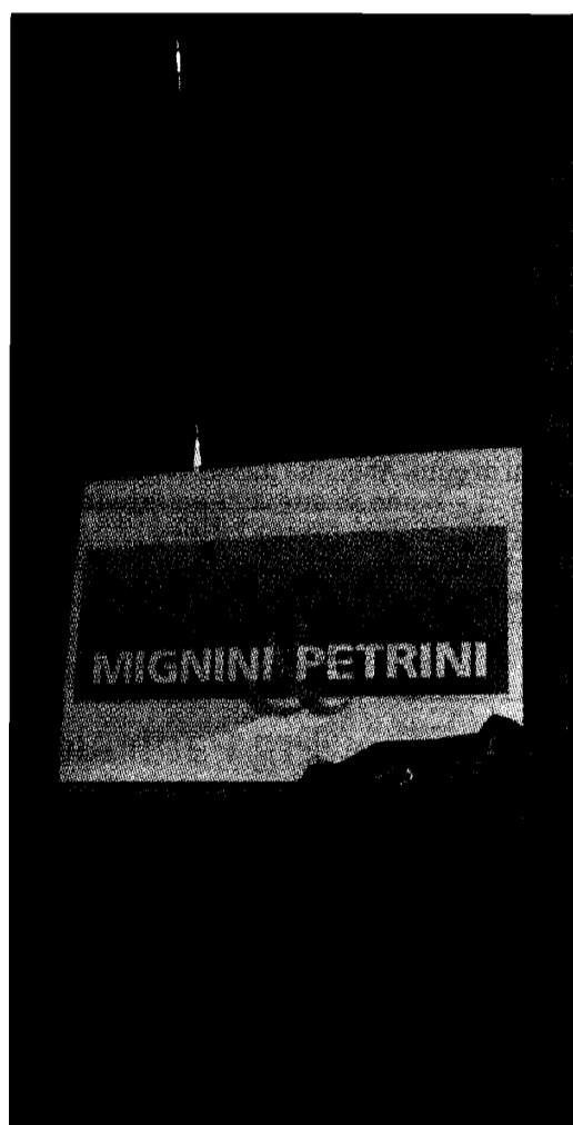
Il simbolo del nuovo gruppo nato dalla fusione

operanti in Umbria, ma questo, conclude il sindacalista, non deve portare ad alcuna perdita occupazionale". Oltre a "mobilitare" l'assessore Giovanetti (che avrebbe promesso "di effettuare verifiche sia con il Comune di Bastia che con quello di Assisi, assicurando un costante raffronto con le organizzazioni sindacali e con le Rsu aziendali"), i sindacati e le stesse Rsu chiedono a tutte le istituzioni coinvolte, ed in particolare al Comune di Bastia, "di vigilare sul percorso relativo alla modifica di destinazione d'uso dell'area industriale" dove è insediato lo stabilimento Petrini, "anche perché, sottolineano i sindacati, all'interno dell'area stessa convive un'altra realtà produttiva, la Molino Spigadoro Spa, che non dovrebbe allo stato attuale essere interessata dalla vicenda, ma che in caso di modifica del Prg potrebbe subire ripercussioni". Intanto, si terrà oggi a Roma un coordinamento nazionale delle segreterie del gruppo Mignini-Petrini per "cominciare a discutere su quelle che possono essere le ripercussioni del piano industriale".