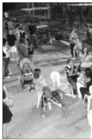
L'apertura delle taverne

I verdi di san Rocco lunedì presenteranno invece "Metro. Prossima fermata Carmen!" con un'ambientazione contemporanea e allo stesso tempo surreale a fare da scenario alla sfilata. Ritratti metropoli-