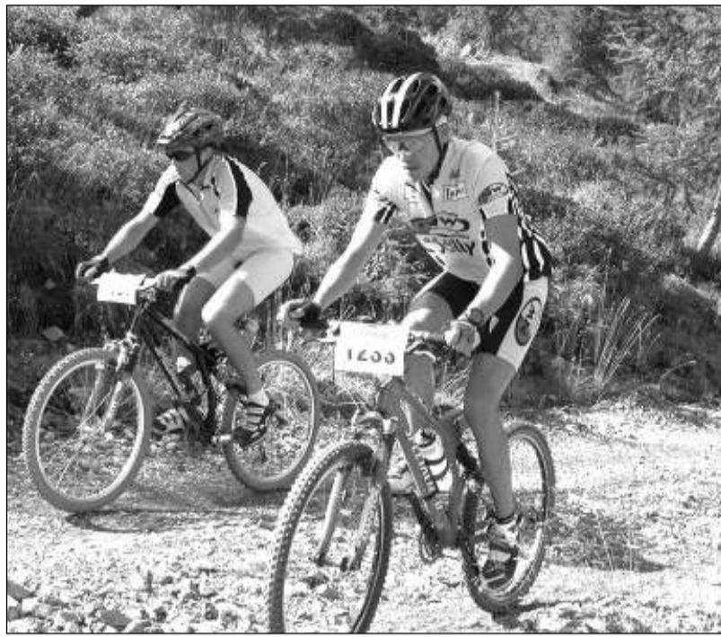
IN GRUPPO - Una foto della passata edizione con gli scalatori in azione

Si tratta del terzo Trofeo "Santa Rita" in programma a Farnetta di Montecastrilli. Organizzata dall'Uc Nestor Sea Marscia-