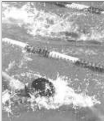
Grande spettacolo a Bastia

CLASSIFICA FINALE REGIONI: 1) Lombardia (26.037,28 punti), 2) Emilia Romagna (25.037,28), 3) Veneto (22.498,82), 4) Marche (20.523,86), 5) Lazio (20.259,19), 6) Toscana (16.582,84), 7) Piemonte (12.383,11), 8) Abruzzo (11.369,79), 9) Puglia (6.963,70), 10) Umbria (2.458,65).