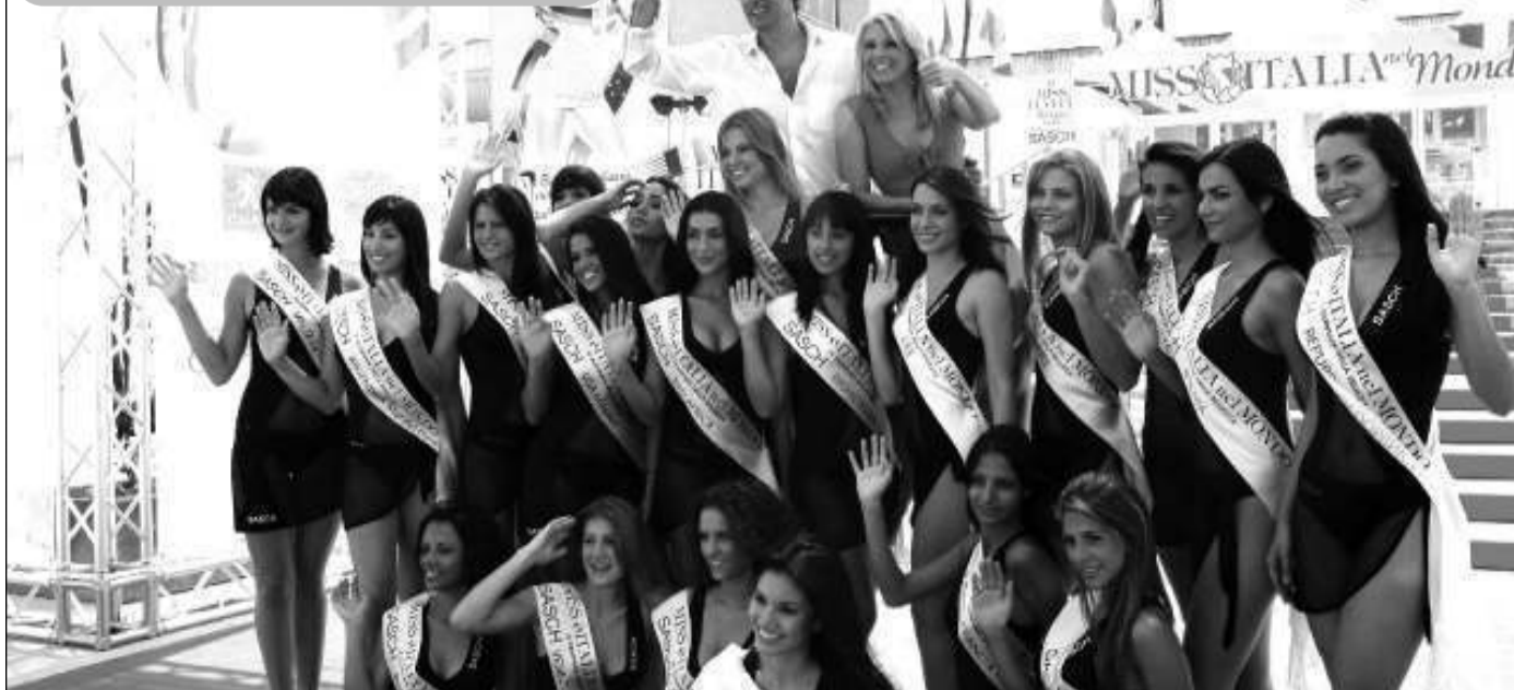
Massimo Giletti e Eleonora Daniele posano davanti al Palacongressi di Jesolo con alcune concorrenti al concorso Miss Italia nel mondo.