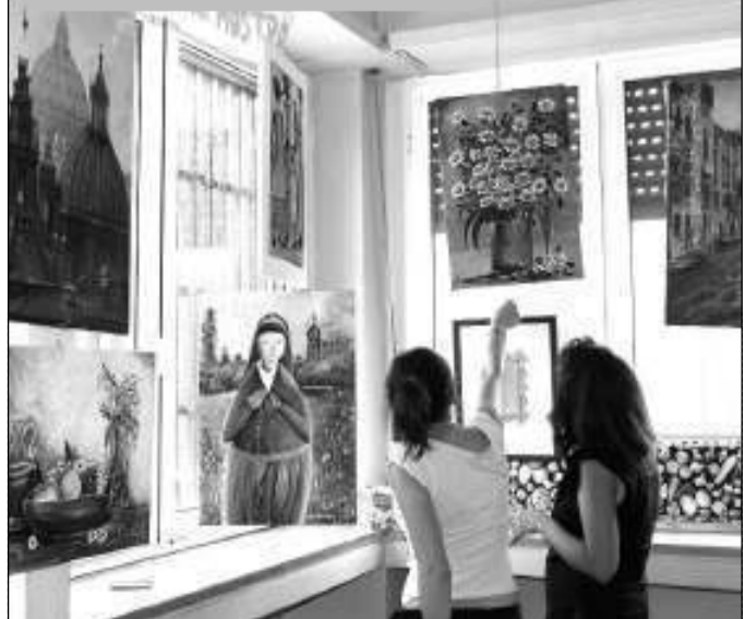
Per alcuni giorni l'ambulatorio della Asl di via Cartagine a Roma è stato trasformato in una galleria d'arte. Non per artisti comuni, ma per sette pittori immigrati (da Brasile, Iran, Perù, Repubblica Moldova, Romania, Ucraina) vicini all'associazione "Cittadini del mondo".