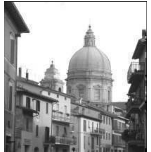
Una veduta di S. Maria degli Angeli

ASSISI - La giunta comunale ha approvato l'indizione del bando di gara per realizzare una nuova strada che, dei comparti II e III dell'area industriale di S. Maria degli Angeli, arriverà a Tordandrea. L'intervento, circa 450.000