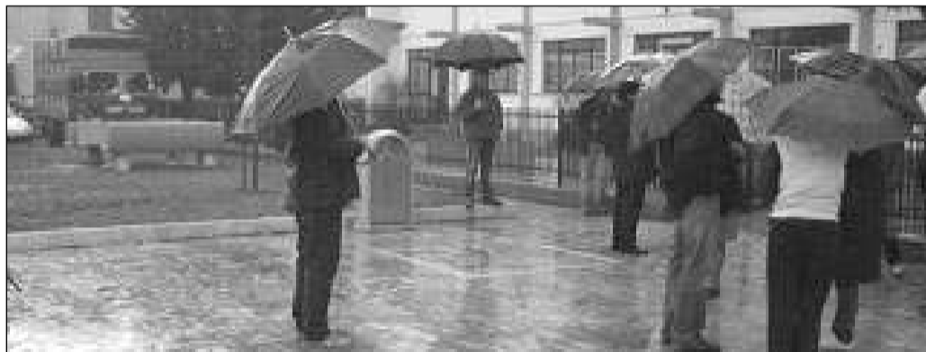
Il piazzale che si allaga

più di un anno sono costretti a camminare con i piedi a bagno per portare i bambini a scuola dopo aver sopportato per dodici mesi il disagio provocato dai lavori di sistemazione e che ne dovranno sopportare altri, al momento del nuovo intervento".