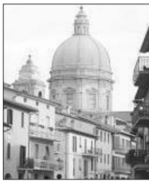
La basilica di Santa Maria degli Angeli