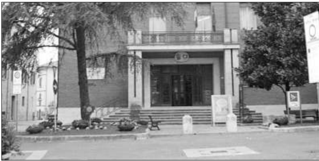
Il Comune di Bastia Umbra