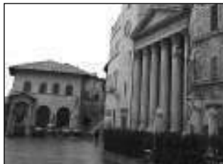
Il centro storico di Assisi

ASSISI Uffici postali chiusi, il sindaco sollecita le Poste