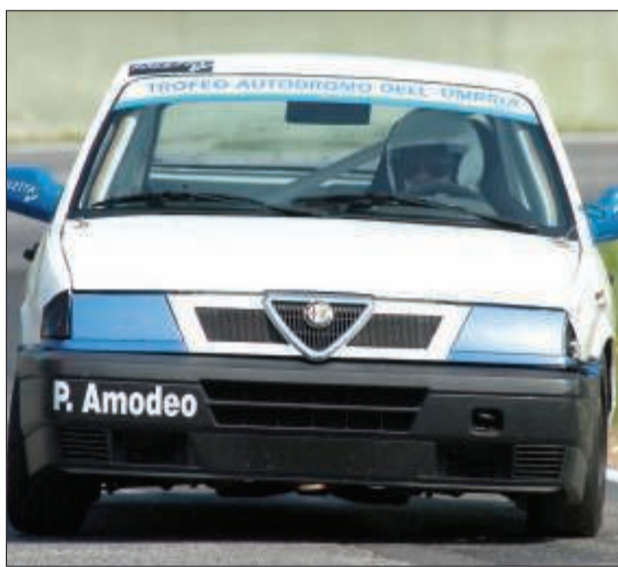
Amodeo in gara nel trofeo Alfa 33 sul circuito di Magione

infatti un bottino di 296 punti conquistati nei quattro appuntamenti finora disputati e le gare in programma domenica potreb-