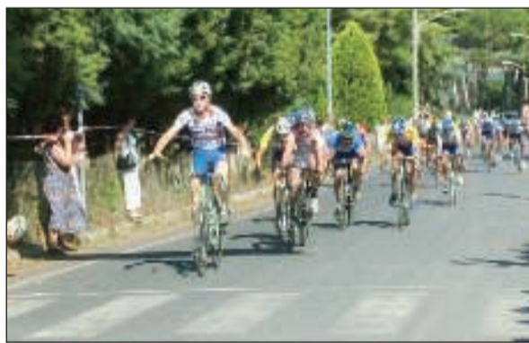
Ciclisti in azione durante la prima edizione della manifestazione