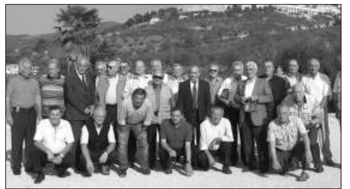
Gli ex alunni del "Fiumi"

ASSISI - Il 23 settembre scorso, dopo 53 anni, si sono ritrovati ad Assisi gli ex alunni diplomati nell'anno scolastico 1953-54 presso la scuola di avviamento professionale industriale maschile "V.Emanuele Fiumi". Dopo oltre mezzo secolo è normale per chi si è perso di vista non riconoscersi. Tra commosse strette di mano ed abbracci gli ex alunni si sono ritrovati presso un noto ristorante della campagna di Assisi dove hanno trascorso la festa, quasi tornando bambini, con i ricordi e i racconti delle birichinate nei confronti degli insegnanti di quel tempo.