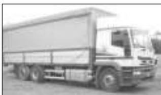
Problemi ad Ospedalicchio dopo il divieto di transito per i camion in via S. Bartolo

In questo modo i camion passano dentro la frazione