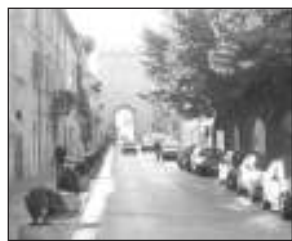
Il centro storico di Assisi

ASSISI - Il giudice di pace ha accolto un ricorso di una cittadina che era stata multata