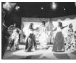
Un momento delle sfilate del Palio