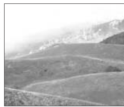
Una veduta del Subasio