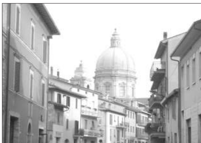
Discussioni sul sottopasso di S. Maria degli Angeli